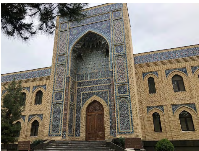
Халқаро Ислоҳ академияси, Тошкент, Ўзбекистон © Стив Свирдлов, 2020 йил октябр.

бўлган одамлардир. Бу сўзлар Ўзбекистон тақиқланган гуруҳларнинг зўравонлик ҳаракатларини содир этмаган оддий аъзоларини қамоққа олаётгани ҳақидаги хулосани янада кучайтиради. Ҳақиқатан ҳам, Ўзбекистон ҳукумати сиёсати диний ёки сиёсий маҳбусларни, улар ўз айбига иқрор бўлиши шарт билан озод қилишдан иборат, бу эса кўп ҳолларда уларнинг диний эътиқодларини бузиши мумкин ва ҳукуматни биринчи навбатда, уларнинг ноқонуний қамалишини келтириб чиқарган аввалги ва ҳозирги муаммоларни текшириш зарурлигидан озод қилади. Шубҳасиз, ҳукумат зудлик билан жиноий жавобгарлиги Ўзбекистон ҳукумати «экстремистик» ёки «террористик» деб ҳисоблайдиган гуруҳларга аъзоликка асосланган барча ҳолатларни бундай маҳбусларни озод қилиш мақсадида кўриб чиқиши керак.