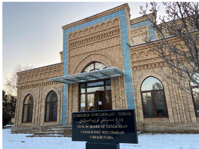
Ўзбекистон мусулмон кенгаши, совет даврининг муфтийси вориси, имомларни тайинлаш ва лавозимидан озод этиш, ваъз мазмунини назорат қилиш ва ислом маросимлари ва амалиётларининг мақбуллигини белгилаш орқали ислом амалиётини тартибга солади. © Стив Свездлов, 2020 йил ноябрь.

Бироқ, давлатнинг ислом билан муносабатлари совет даврига нисбатан жуда оз ўзгарди. 1992 йилга келиб, Совет давридаги Мусулмонлар диний бошқармаси тарқатиб юборилди ва Ўзбекистонда ва Марказий Осиёнинг ҳар бир давлатида Мусулмонларни тартибга солиш кенгаши (муфтият) ташкил этилди. Каримов ҳукумати айниқса, Каримовнинг қўшни Тожикистон ва Афғонистонни қамраб олган зўравонлик, фуқаролар уруши ва беқарорликнинг сабаблари ҳақидаги қарашларига асосланган ҳолда, мустақил ислом амалиётига таҳдид сифатида қарай бошлади.