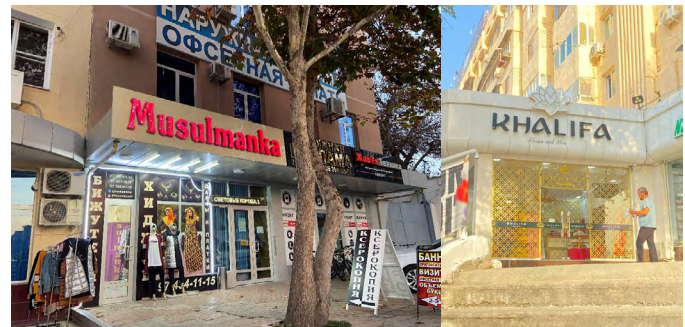
Авторитар президент Ислом Каримов вафотидан сўнг ҳокимият ҳижоб каби диний кийимлар устидан назоратни бўшаштирди ва бутун мамлакат бўйлаб Ислом кийимларини сотадиган дўконлар пайдо бўлди. Юқоридаги расм © Стив Свездлов, 2020 йил ноябрь; пастки расм © Стив Свездлов, 2021 йил июль.

Ҳукумат йиллар мобайнида рўйхатга олинмаган диний ёки экстремистик гуруҳларга алоқадорликда гумон қилинган минглаб шахслардан ташкил топган “қора рўйхат”ни юритган. Рўйхатга киритилганлар учун турли ишларга жойлашиш ва саёҳат қилиш тақиқланарди ва улар мунтазам равишда милицияга суҳбатга келиб туришлари шарт эди. 2017 йилнинг август ойида ҳукумат “қора рўйхат”да одамлар сонининг 17 582 тадан 1352 тагача қисқаришини эълон қилди. Ушбу қадамни ёритган оммавий чиқишларда президент Мирзиёев радикал гуруҳлар томонидан “йўлдан оздирилган” фуқароларни реабилитация қилиш зарурлигини таъкидлади. Кейинчалик ҳукумат “қора рўйхат”дан барча шахсларни чиқариб юборилганини эълон қилди, аммо буни мустақил равишда текшириш қийин.