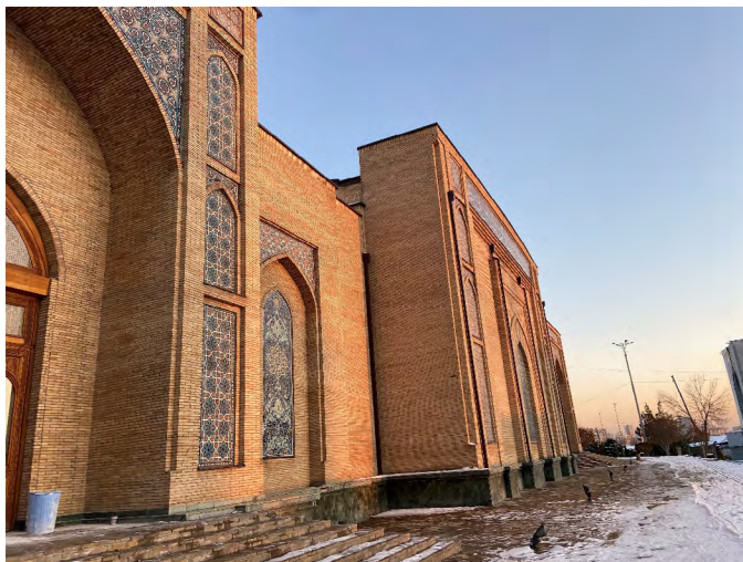
Ҳазрати Имом масжиди мажмуаси, Тошкент Стив Свирдлов, 2020 йил ноябрь

Ҳукумат ва Браунергнинг рақамлари сунъий равишда камайтирилган кўринишда, чунки улар Ўзбекистоннинг барча ҳудудларини, ҳукумат томонидан қўлланиладиган жиноий айбловларнинг кенг доирасини ва Россия, Қирғизистон ёки бошқа яқин давлатлардан экстрадиция қилинганидан кейин қўлга олинган ва уйдирма айбловлар бўйича қамоқ жазосига ҳукм қилиниши мумкин бўлган шахсларнинг сонини ҳисобга олмаган. “Мемориал”га кўра, 2003 охирида келиб ҳукумат сиёсий ёки диний сабабларга кўра камида 5900 кишини қамоққа ташлаган. 16 2004 йилда Хьюман Райтс Вотч ҳукумат томонидан олиб борилган диний таъқиблик кампанияси алақачон 7000 кишини ҳибсга олиш, қийноққа солиш ва қамашга олиб келганини аниқлаган. 17 2004 йилнинг март ойида ҳукумат экстремистик диний ташкилотларда иштирок этгани учун ҳукм қилинган 2836 нафар маҳбусларнинг мавжудлигини тан олди. АҚШ Давлат департаментининг ўша даврдаги баҳолари 5000-5500 кишини ташкил этди.